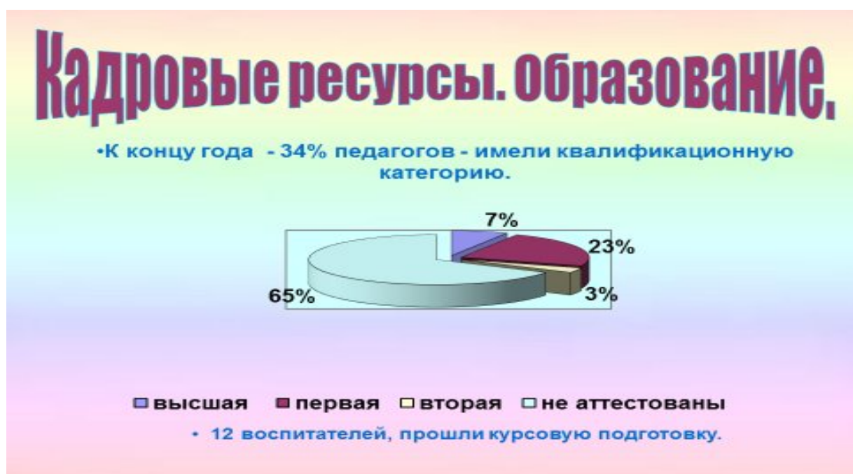
Рисунок 3 «Характеристика педагогических кадров по категориям»